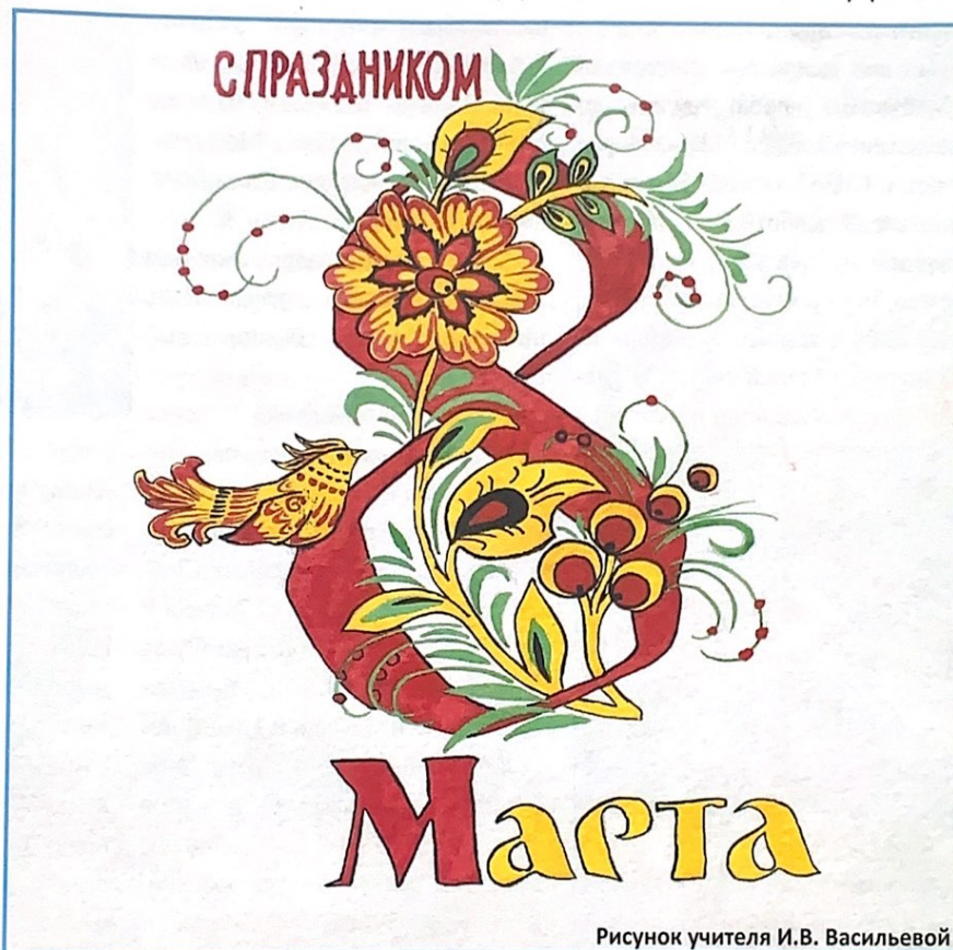
Рисунок учителя И.В. Васильевой