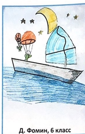
Д. Фомин, 6 класс