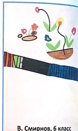
В. Смирнов, 6 класс

© 2016 ГКОУ ЛО «Киришская специальная школа-интернат»