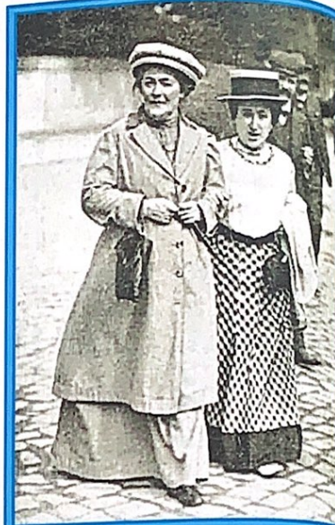
Клара Цеткин (слева) и Роза Люксембург, 1910 год

8 марта - это первый праздник весны - самого прекрасного времени