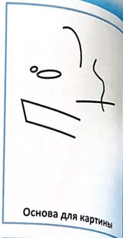
Основа для картины