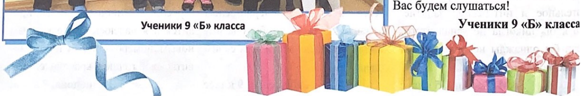
Ученики 9 «Б» класса