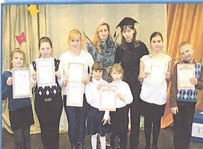
Награждение лучших знатоков русского языка