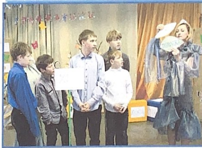
Поиск и подбор однокоренных слов