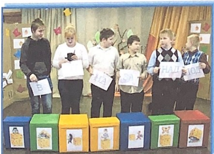
Расстановка предлогов по своим местам