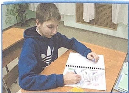
За решением конкурсных заданий по русскому языку