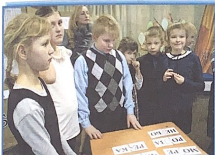
Составление слов из слогов, данных вразбивку