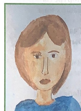
Рисунок Васильева В., ученика 5 класса