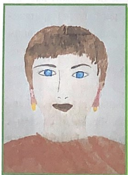
Рисунок Диц Н., ученицы 5 класса