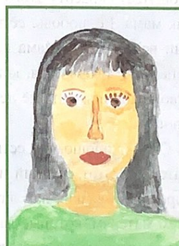
Рисунок Отпетова Н., ученика 5 класса