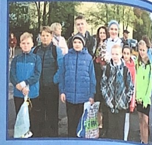
И ребята, и педагоги застыли на торжественной линейке под звуки гимна России.