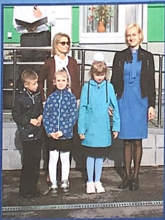
Ученикам и педагогам школы представили малышей-первоклассников.