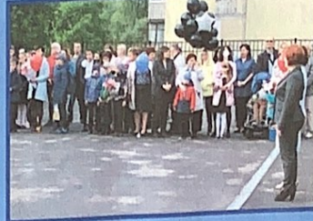
Все классы выстроились на школьном дворе. Всё было наполнено торжеством и гордостью.