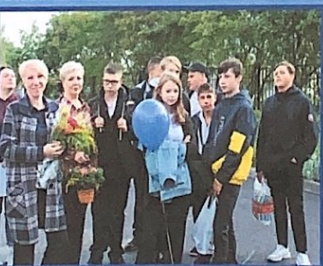
Нарядные ученики и педагоги с пёстрыми букетами цветов.