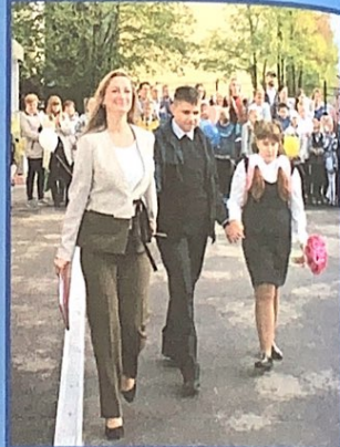
Ученики 9 «А» и 9 «Б» класса совершили на линейке круг почёта вместе со своими классными руководителями.