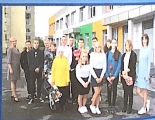
День знаний продолжился классными часами и тематическими линейками.