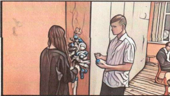
Предновогодний класс. Школьники украшают ёлку. Мальчик влюблённо смотрит на девочку.