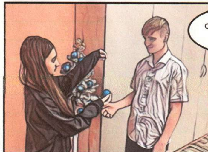
Подходит девочка с шариком и смотрит на мальчика.

Ух ты! Сработало желание! Но надо было загадать Айфон.