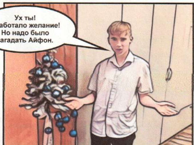
Мальчик в удивлении разводит руками.

Ух ты! Сработало желание! Но надо было загадать Айфон.