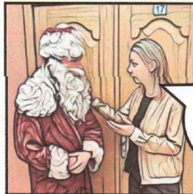
За дверью учитель разговаривает с переодетым в Деда Мороза учеником.

И обязательно им скажи, чтобы они загадали хорошую успеваемость по моему предмету.