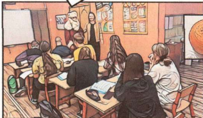
Учитель входит в класс вместе с Дедом Морозом.

С Новым годом! Вы, наверняка, совершали хорошие поступки, поэтому в подарок получаете волшебный мандарин. Съешьте его и загадайте желание.